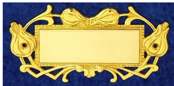
Namensschilder Seite 23 - 26