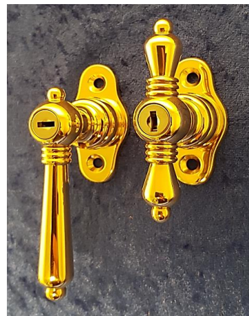
Fensterbeschläge Seite 9 - 13