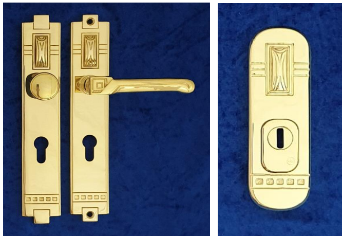
Türbeschläge Seite 2 - 8