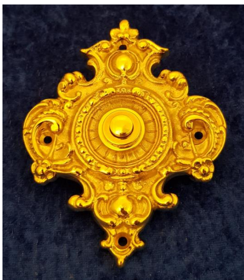
Klingeln Seite 16 - 21