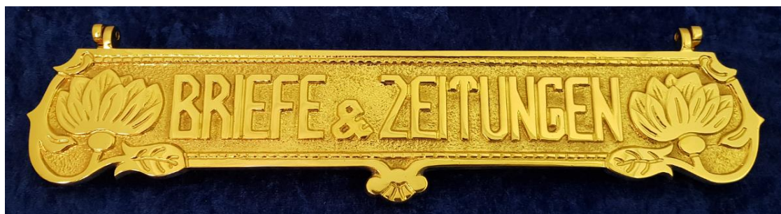
Briefeinwürfe Seite 27 - 29